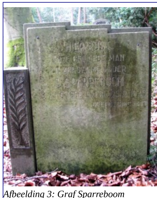
Afbeelding 3: Graf Sparreboom

Op 25 juni is het precies 111 jaar geleden dat Jacob Sparreboom werd geboren. Het verhaal over zijn leven, zijn werken en zijn gezin is beschreven in ons boek Grafstenen krijgen een gezicht .